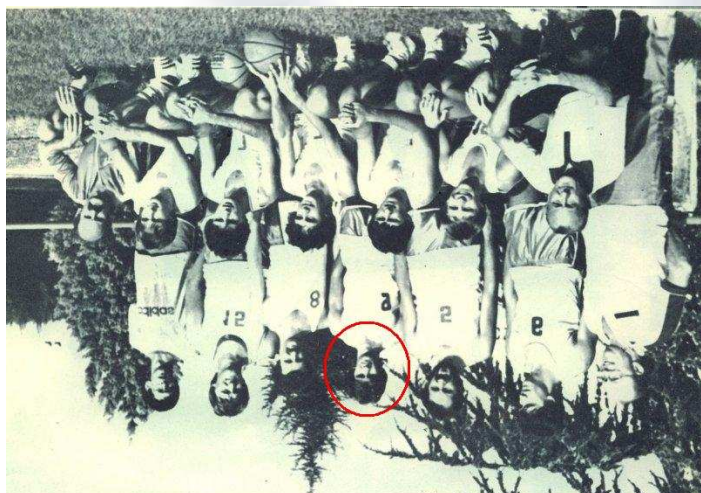
Senior 1, 1983/1984